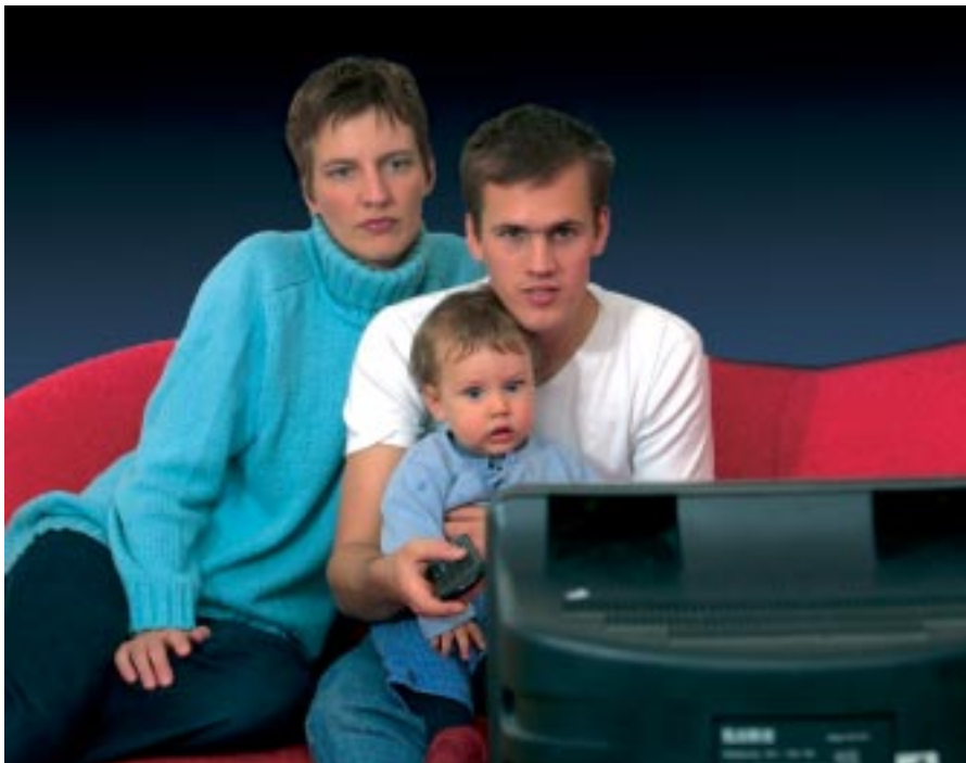
Das Institut Isopublic beobachtete das Fernsehverhalten von insgesamt 200 Testpersonen aus der Schweiz in zwei parallelen Vergleichsgruppen. Die Testpersonen sahen das Programm jeweils in ihrer gewohnten Fernseh Umgebung.